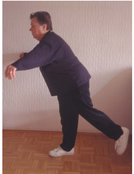
Leicht durchführbare Übungen zur Verbesserung von Kraft und Balance fördern die sichere Mobilität.

Haben sich alle Beteiligten nach erfolgreichem Beratungsprozess auf Interventionen verständigt, erstellt die zuständige Pflegefachperson einen Maßnahmenplan. Anhand dieses Maß-