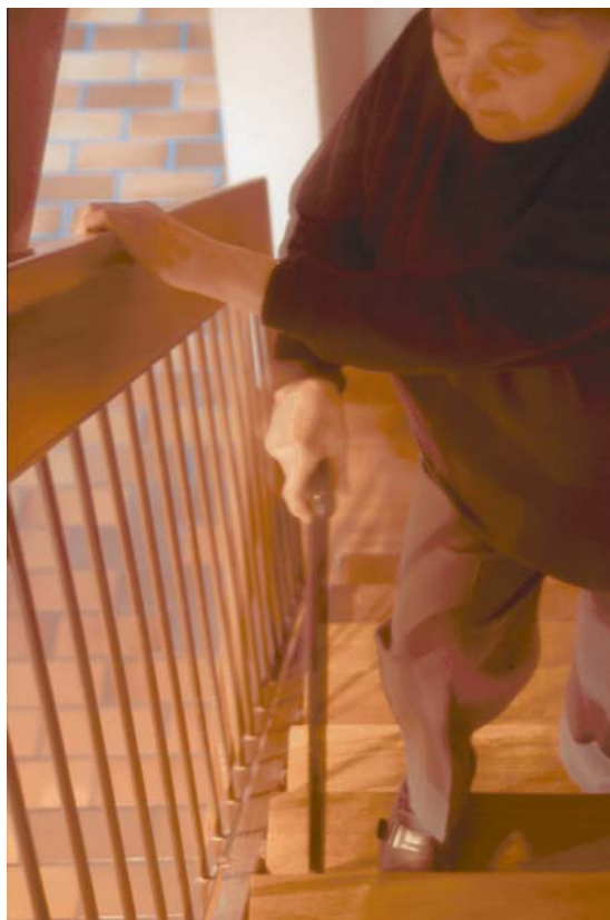
Stürze haben immer mehrere Gründe. Manchmal ist die unsachgemäße Verwendung von Hilfsmitteln nur noch der Auslöser.

Da Stürze aber Ereignisse sind, welche immer durch eine Verkettung ungünstiger Umstände zustande kommen, gibt es auch immer mehrere Ansatzmöglichkeiten, um ihnen vorzubeugen. Stürze gehören aufgrund unserer aufrechten Körperhaltung unvermeidlich zum Leben dazu, daher werden letztlich nicht alle Stürze zu verhindern sein, aber die Wahrscheinlichkeit, dass es in einigen ungünstigen Situa-